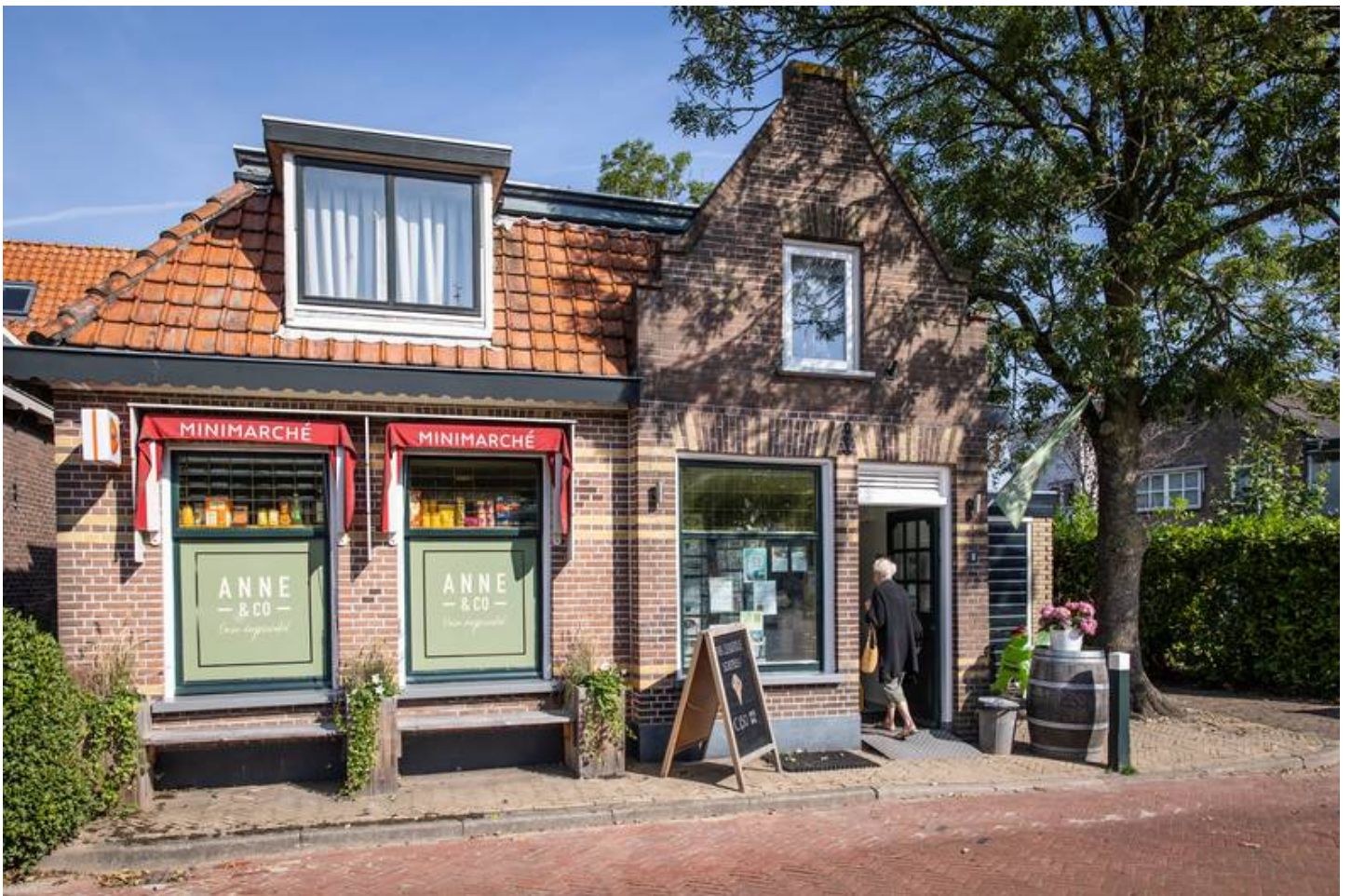
Dorpswinkel Anne & Co in Ilpendam.